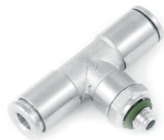
T-Verschraubung, schwenkbar und zylindrisch